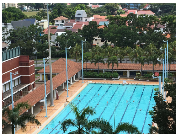
Bassin extérieur de 50 X 21 mètres où une noyade a été détectée en août 2018 par le système Poséidon

En août 2018, les technologies de Poséidon ont permis de détecter un homme de 64 ans qui gisait, après avoir perdu connaissance, depuis plus de 10 secondes sur le fond du bassin. La victime a été secourue par le personnel de surveillance qui est intervenu dès le déclenchement de l'alarme. Cette nouvelle détection confirme le savoir-faire de Poséidon et l'intérêt de cette solution pour répondre à une demande sociétale de plus en forte en matière de prévention des risques d'accident.