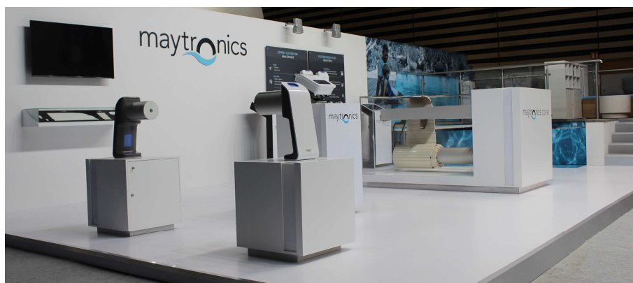
La nouvelle gamme de couvertures Maytronics Covers

En effet, l'exercice 2017 a permis de mettre sur le marché une nouvelle série de couvertures de piscines, dévoilées au Salon de la Piscine de Lyon 2016, sous la dénomination Maytronics Covers. Ces couvertures ont reçu un accueil très favorable des constructeurs / installateurs de piscine, et ont permis à MG International d'entrer sur le segment des couvertures haut de gamme.