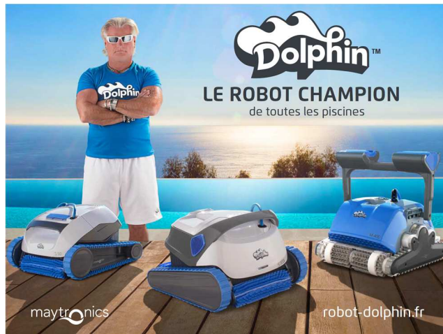
Campagne d'Affichage (mai 2017)

Cette campagne, déclinée en affichage et en digital et relayée par le puissant réseau de distribution de la société s'est traduite par la forte progression de 24% de l'activité Robots sur l'exercice 2017.